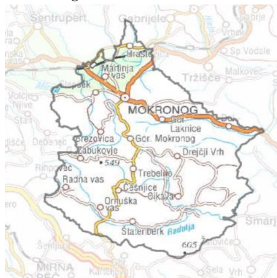
Slika 1: Območje Občine Mokronog-Trebelno

Občina Mokronog - Trebelno kot del osrednje Slovenije, natančneje Srednje Dolenjske, ki se razpoteza po Mirnski dolini in Raduljskem hribovju, je izrazito prehodna pokrajina, ujeta v razgiban prostor na stičišču alpskega, dinarskega in panonskega sveta. To je oni svet, ki ga je imel Prežihov Voranc v mislih, ko je pisal »o deželi mehke romantike z neštevilnimi cerkvicami in gradovi, z vinskimi goricami in zidanicami, z grički in dolinami, koder živi dobro ljudstvo lãhko, brezskrbno življenje, pije cviček in prepeva, hodi po božjih poteh in lovi polhe - nekaka dežela poezije, katero lahko zavidamo drugi Zemljani.«